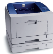
Phaser 3435 con bandeja 2 opcional